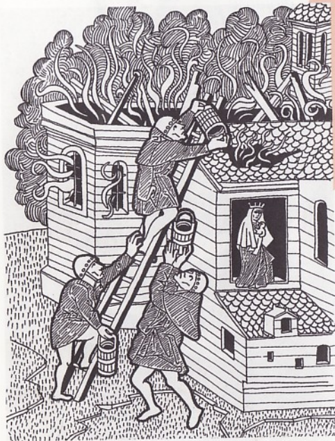
Au Moyen Âge, des moines essaient d'éteindre l'incendie d'une église avec des seaux d'eau.

Depuis le Moyen Âge, les équipements des sapeurs-pompiers pour lutter contre les incendies ont évolué et sont devenus bien plus performants.