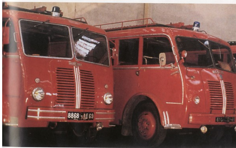
1954 Fourgons incendie.