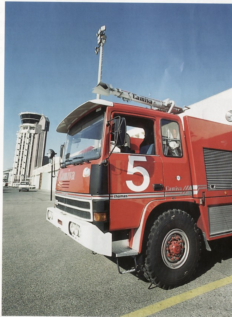
1995 Camion-citerne équipé d'un canon à mousse, prêt à intervenir sur un aéroport.