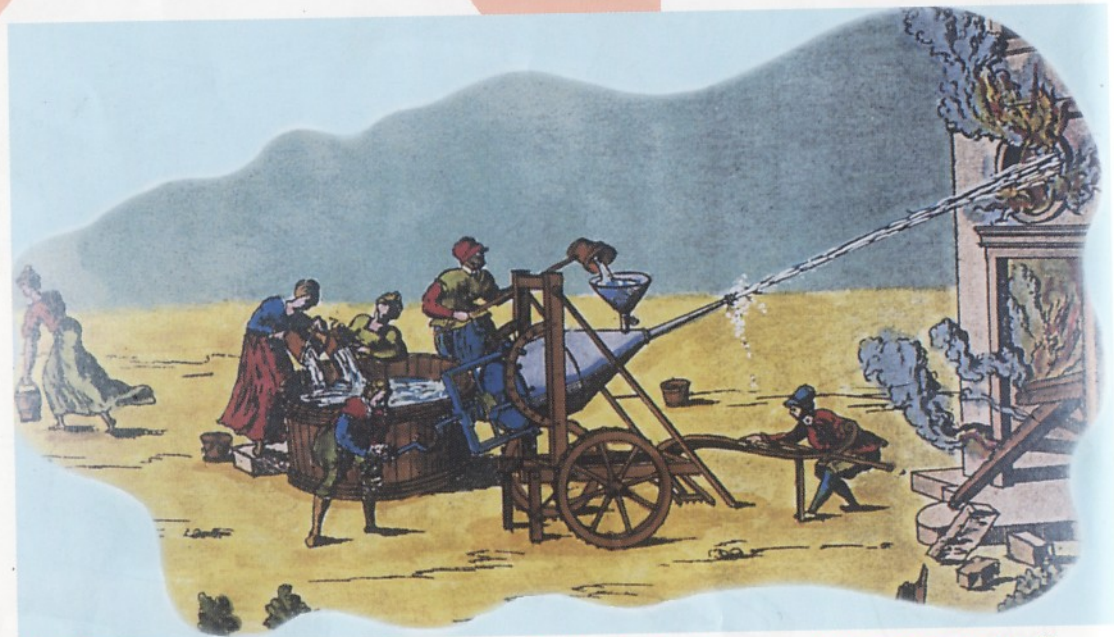
1756 Dessin d'un engin imaginé pour éteindre les feux, mais jamais construit.