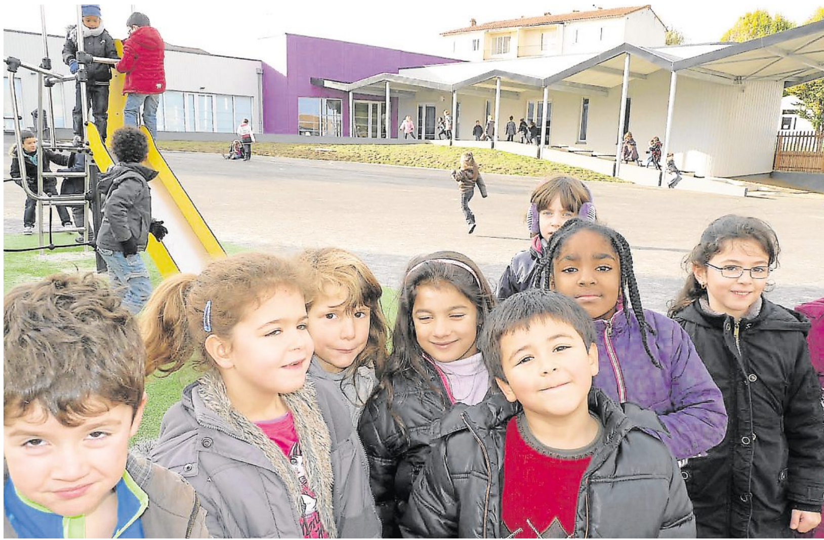
Parthenay, école Gutenberg, mercredi 20 novembre. Les élèves de CP en connaissent un rayon sur les règles et les subtilités des jeux dans la cour de récréation.