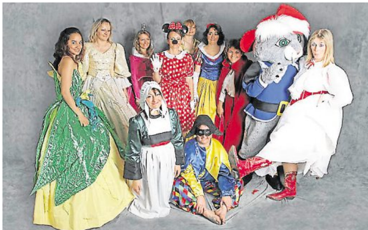
La Boîte à couture fournit plus de 150 costumes pour le spectacle.

Pour la deuxième fois, l'association Danse and Co et La Boîte à couture d'Annie Bienaimé se sont associées pour l'organisation du spectacle « Noël Disney », qui est proposé dimanche prochain à 17 heures dans la salle des fêtes de Pompaire. Cette sorte de comédie musicale propose plusieurs tableaux élaborés à partir de films de Walt Disney : La belle et la bête,