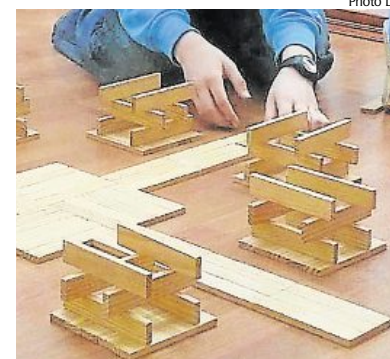
Le Kapla, un jeu de construction à base de planchettes de pin.

Les bambins en raffolent. Le Kapla est un jeu de construction à base de planchettes de pin. Il s'agit d'une version plus précise des « planchettes » auxquelles jouaient les enfants des années 1960. Ce jeu ne nécessite aucun système d'assemblage ; il suffit de superposer les planchettes pour