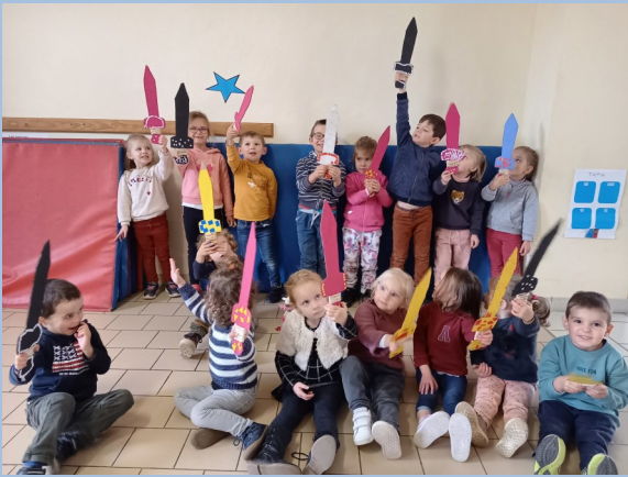
Les épées sont terminées.