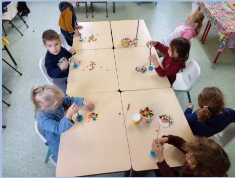
Nous avons travaillé sur les collections de 1 à 4 et sur les algorithmes.