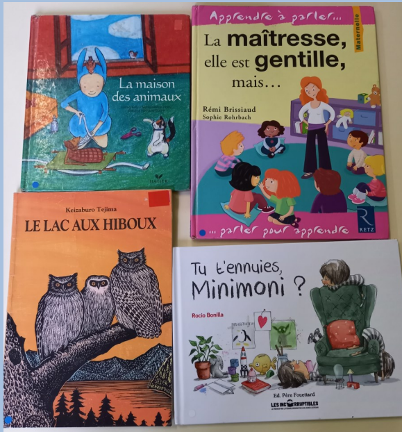
Les 4 albums de la semaines.