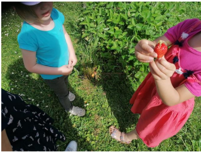
Les premières fraises du jardin sont arrivées!