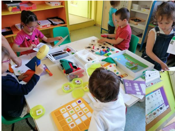
Ateliers des étoiles