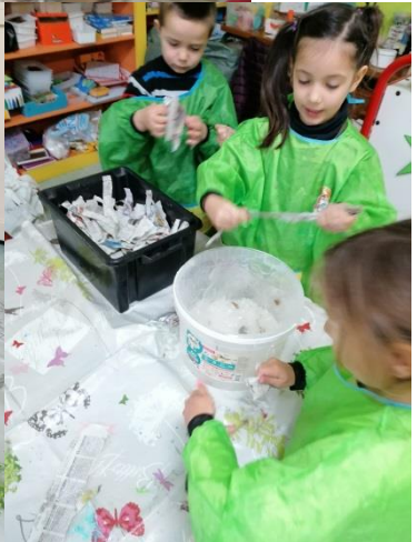
Création d'un panda en papier mâché!