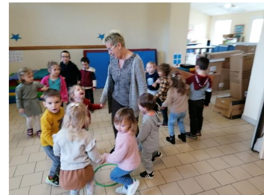
On perfectionne notre danse médiévale!