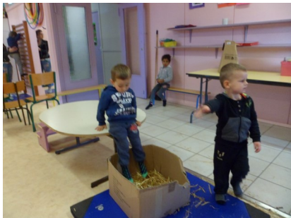
Il faut descendre de la table et aller dans le carton rempli de paille.