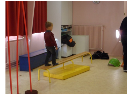
On marche sur le banc à bascule.