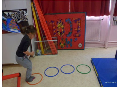
On saute dans les cerceaux à pieds joints.