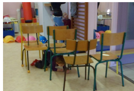
On passe dessous les chaises.