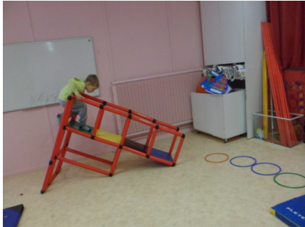
Il faut monter et après glisser sur le toboggan.