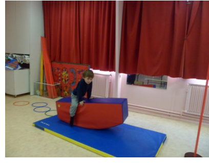
Il faut s'asseoir sur le «cheval» et aller jusqu'au bout, sans toucher le tapis avec les pieds.