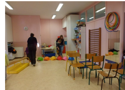
Il faut marcher sur le dos des tortues et il ne faut pas glisser dans