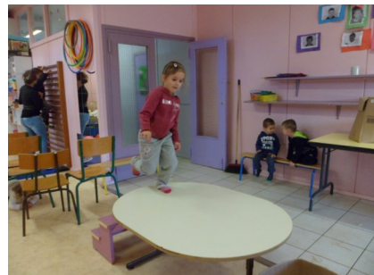
On monte sur la table avec les petits escaliers.