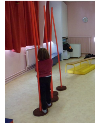
On marche sur des ronds en mousse. On ne doit pas mettre les pieds sur le sol.