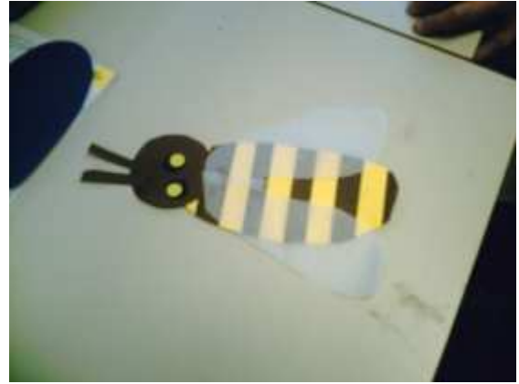
Fabrication d'une abeille.