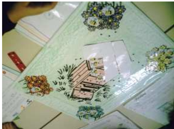
Jeu des abeilles.