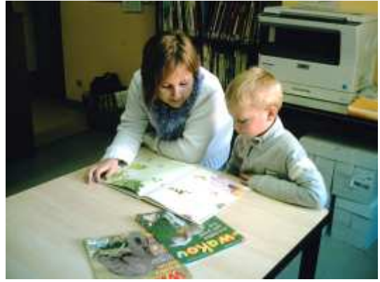
Bibliothèque : lecture d'albums et de documentaires sur l'abeille et le miel.