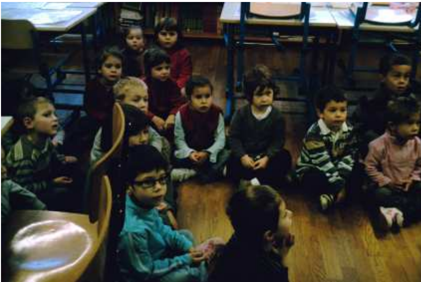
Présentation de la journée : les groupes et les ateliers.