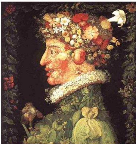
Le printemps- 1563

Il a fait plusieurs séries sur les saisons et une sur les éléments (terre-eau-feu-vent)