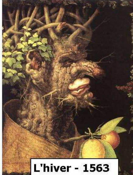
L'hiver - 1563