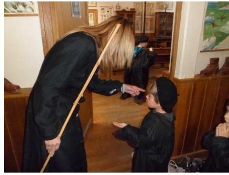
Avant de rentrer en classe le maître regardait si les mains des enfants étaient propres.