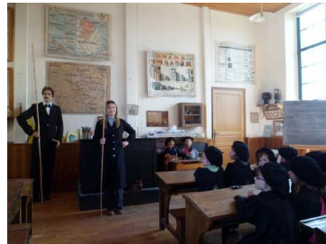
Il fallait attendre pour s'asseoir que le maître le dise.