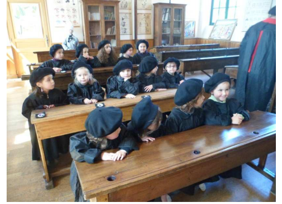
Nous nous sommes installés à un pupitre.