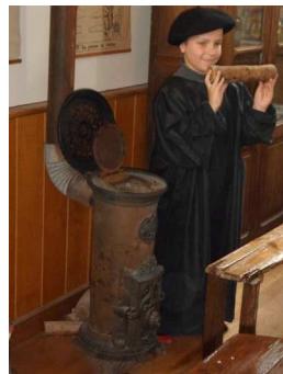
Tous les jours, chaque enfant apportait un bout de bois pour mettre dans le poêle.