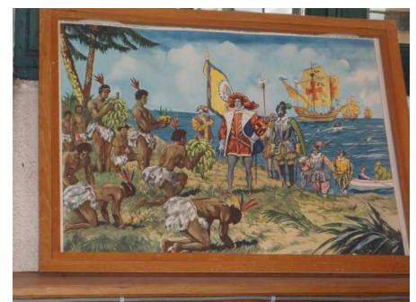
Nous avons vu une image de Christophe Colomb.