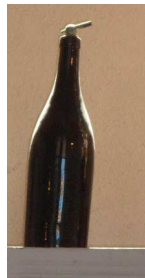
L'encrier et la bouteille à encre.