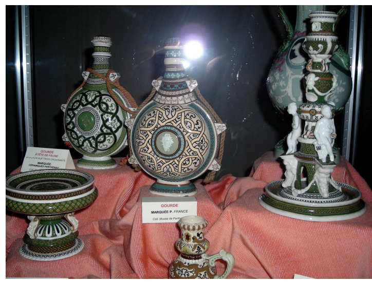
Nous pouvons trouver des faïences dans tout le musée...