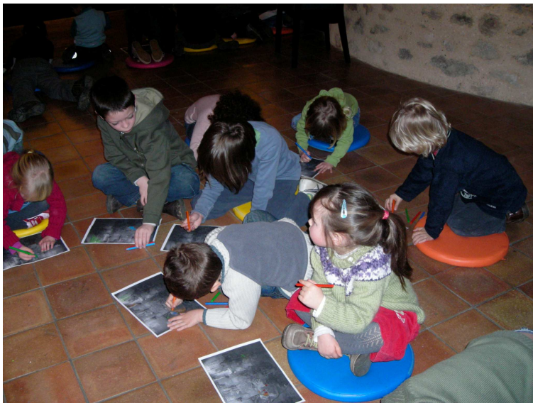
Les élèves colorient un tableau de Monique Baroni Johan