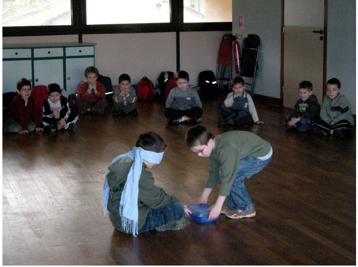
Maxime vole le trésor du roi Tanguy Tanguy