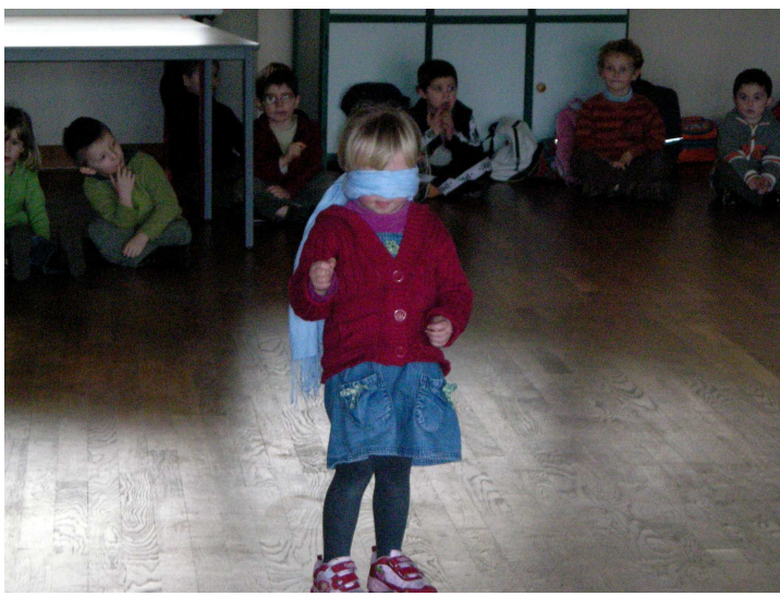
Lilia est la reine du silence.