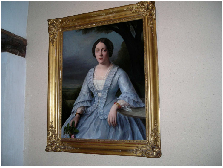
... et également des tableaux.