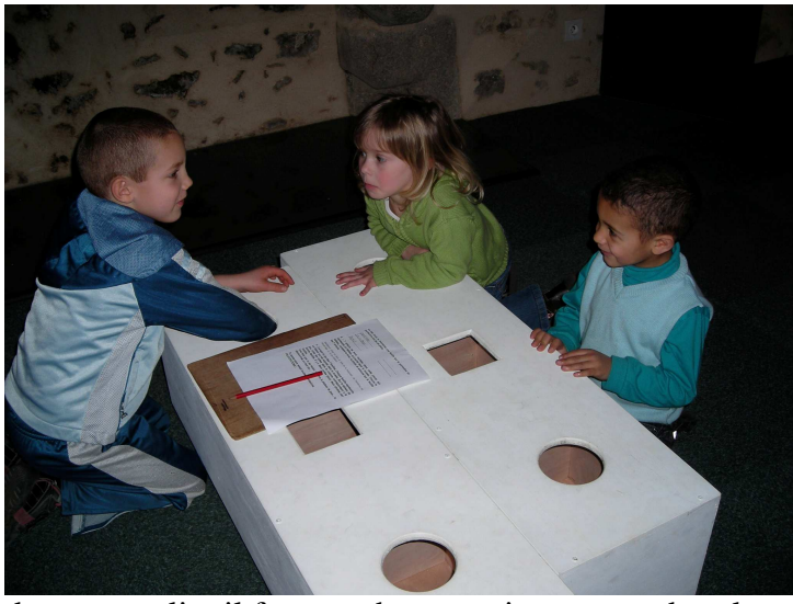
dans cet atelier il faut toucher ce qui se trouve dans les trous et deviner de quel matière il s'agit...