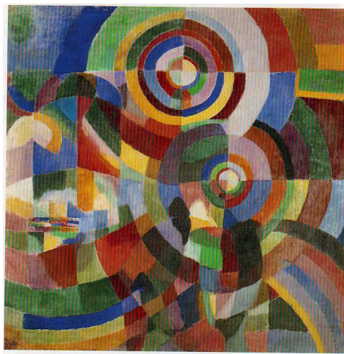
S. D., PRISMES ELECTRIQUES 1914, HUILE SUR TOILE. 2.50 x 2.50