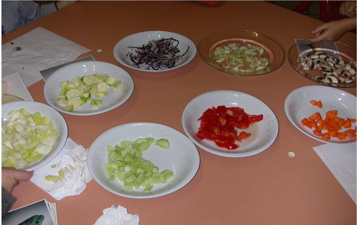
Atelier dégustation de légumes crus: Chou rouge, champignons, tomate, courgette, concombre, fenouil, endive et carotte