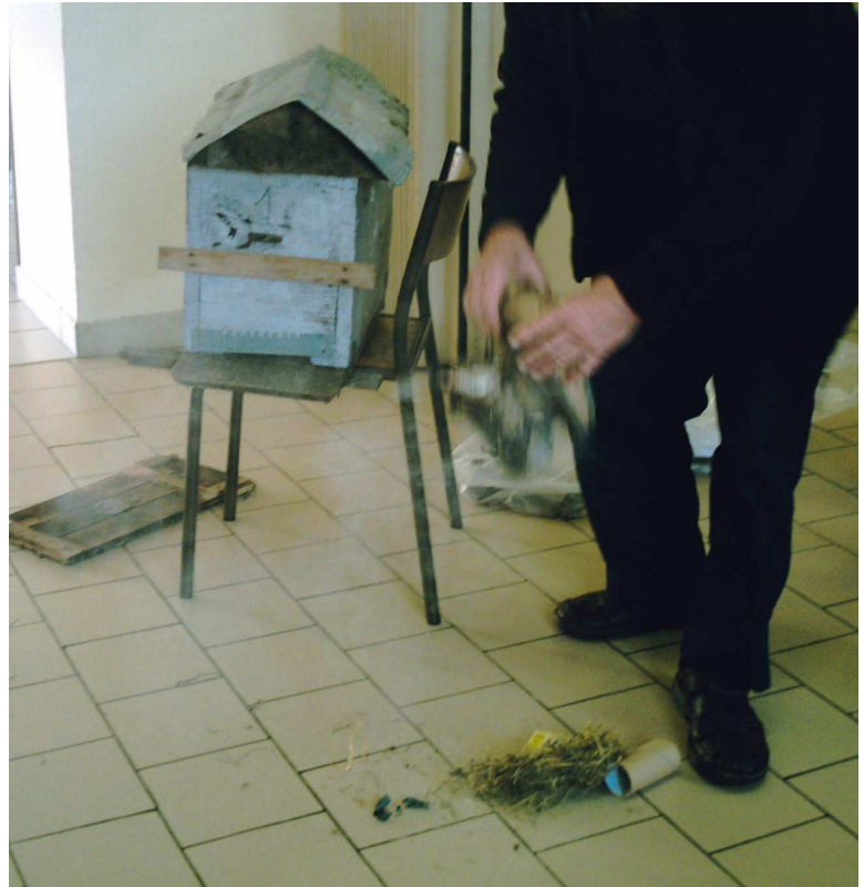
Il met de la fumée dans la ruche pour endormir les abeilles et prendre le miel. Il en laisse pour que les abeilles aient à manger pendant l'hiver.