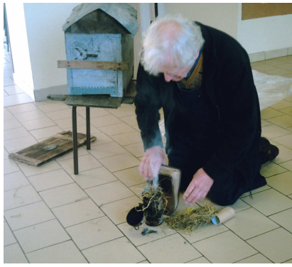
Il met de l'herbe sèche dans l'enfumoir et met le feu.