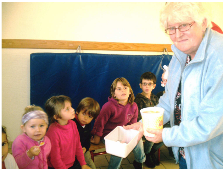
Nous avons goûté le miel. Il était très bon !