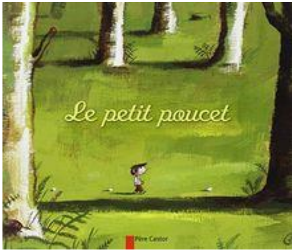
Nouvelle lecture : « Le petit poucet »