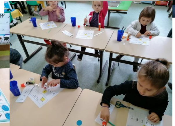
Atelier de manipulation : bricolage avec du carton