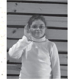
S'il vous plaît