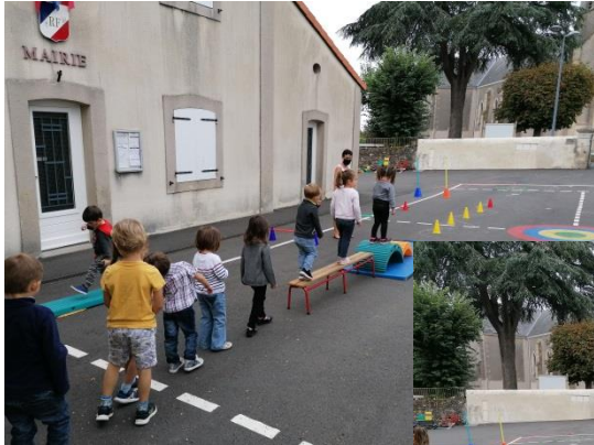
Deux parcours au choix cette semaine : les enfants devaient rapporter des cubes de couleur et les trier à l'arrivée du parcours.