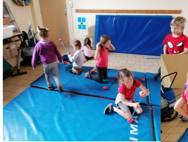
Atelier de construction