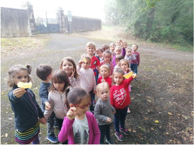
Promenade du lundi : nous avons ramassé des glands sous les chênes de la forêt!