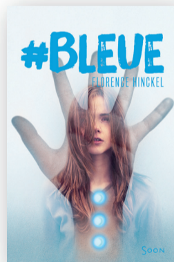
Roman de F. HINCKEL SYROS