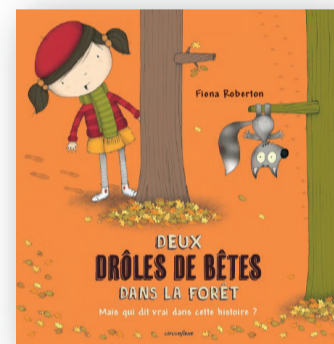
Album de F. ROBERTON CIRCONFLEXE