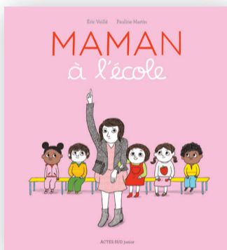
Album de E. VEILLÉ /ILL. P. MARTIN ACTES SUD JUNIOR