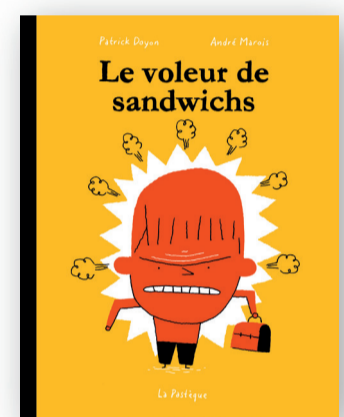
Roman de A. MAROIS ILL. P. DOYON LA PASTÈQUE