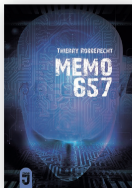
Roman de T. ROBBERECHT MIJADE