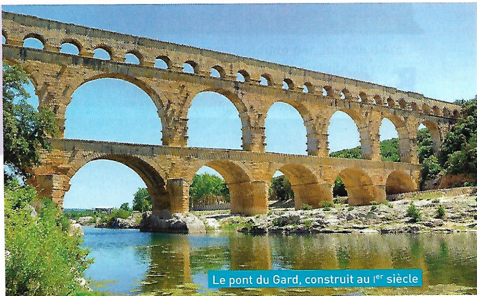
Le pont du Gard, construit au 1 er siècle

Devenue romaine, la Gaule a beaucoup changé. On y a construit des routes, des villes, des monuments, dont certains existent encore.