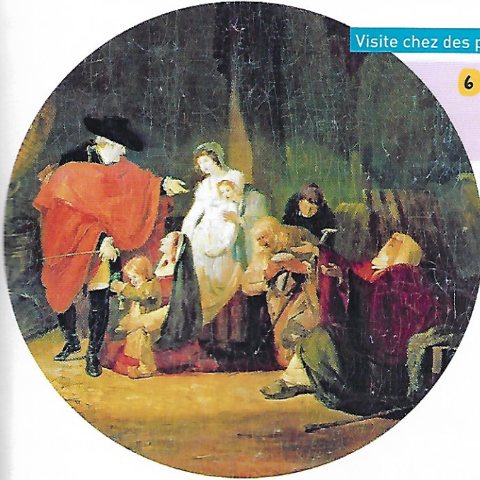
Visite chez des pauvres au XVIII e siècle