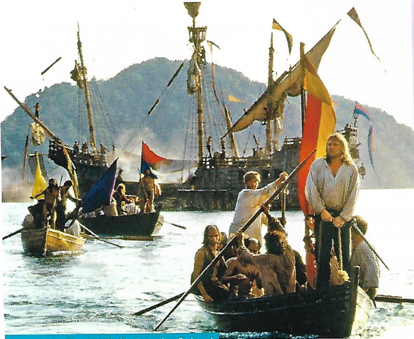
Extrait du film 1492 Christophe Colomb

En 1492, Christophe Colomb navigua jusqu'en Amérique. À l'époque, les Européens en ignoraient l'existence.