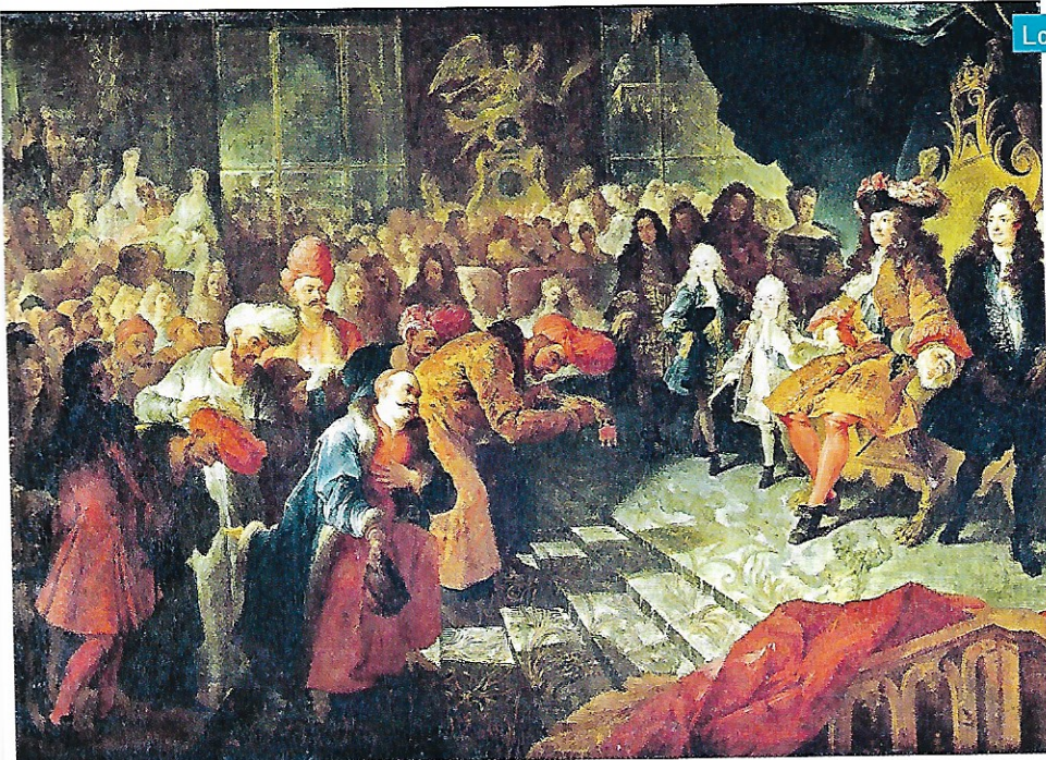
Louis XIV, 1715