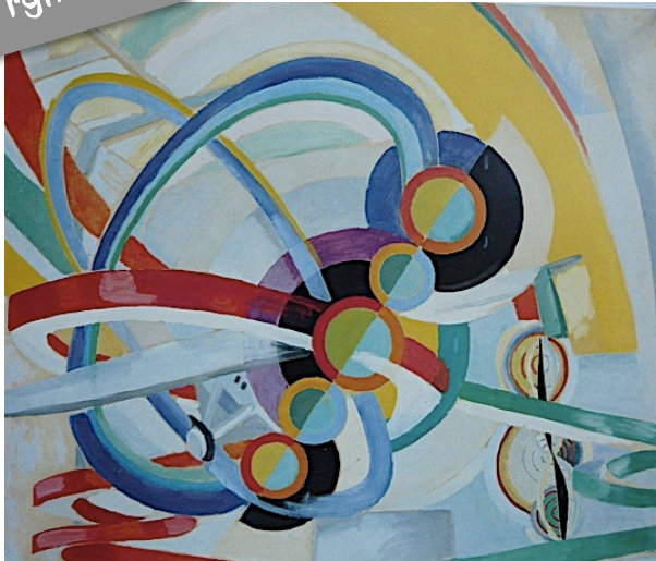
Hélice et rythme