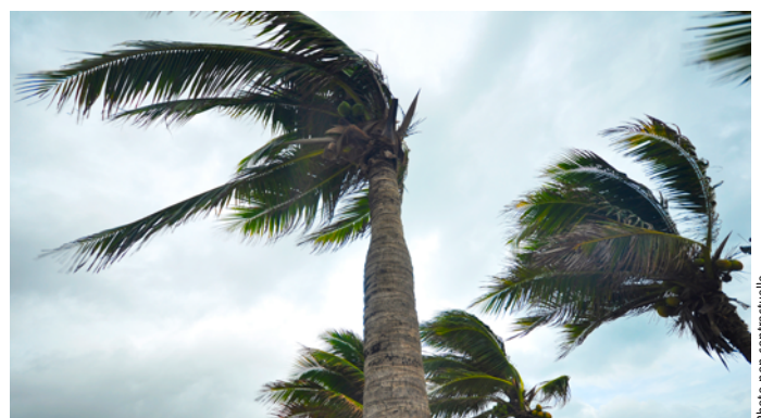
Cette terre tropicale est souvent exposée aux cyclones.

L'intérieur du pays est très désert et les routes sont peu empruntées.