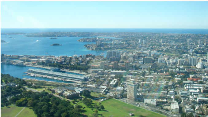
Les villes sont surtout construites au bord de l'océan.