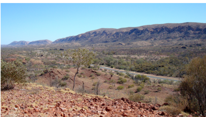
L'intérieur du pays est très désert et les routes sont peu empruntées.