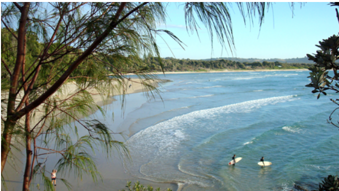
Le surf est une activité de loisir très développée.