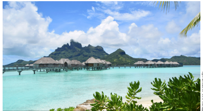
Née d'un volcan, l'île présente des montagnes dans sa partie centrale mais accueille un tourisme littoral.