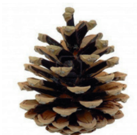
une pomme de pin