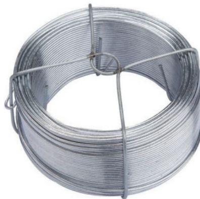
du fil de fer