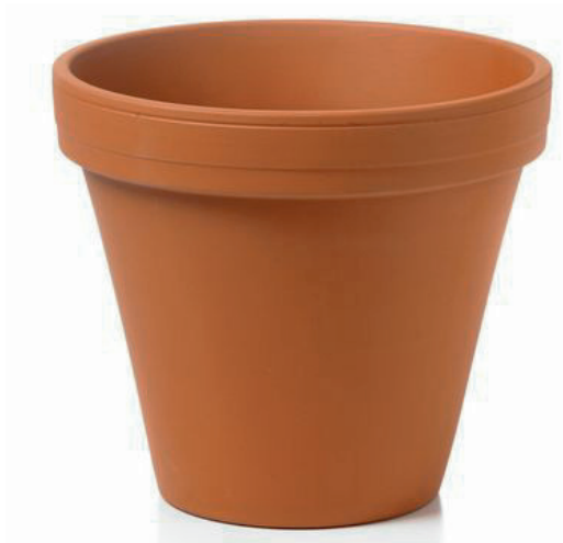
un pot en terre