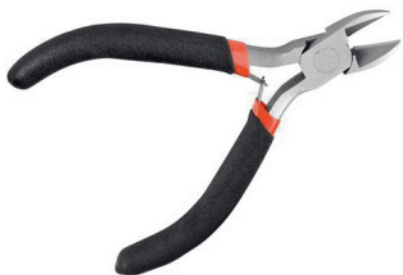
une pince coupante