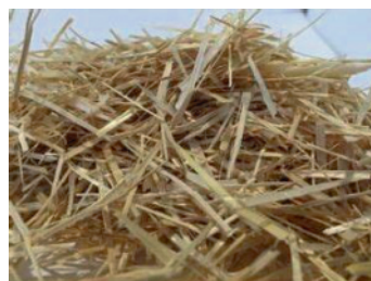
de la paille