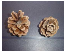
2 pommes de pin