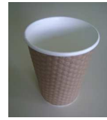
un gobelet en carton