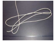
de la ficelle