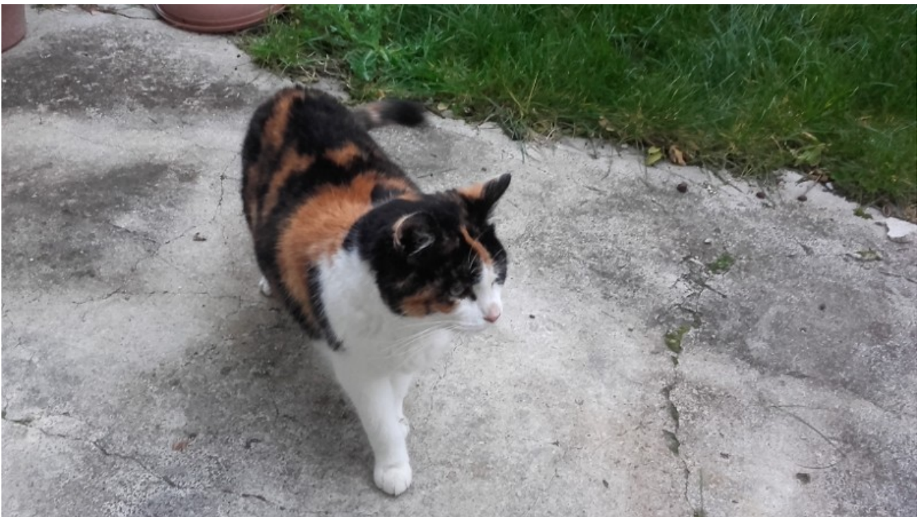
ZORA (Elle est aveugle.)