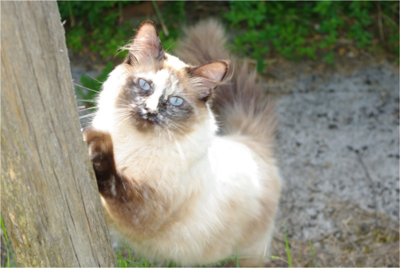
SOURIS dit MINETTE