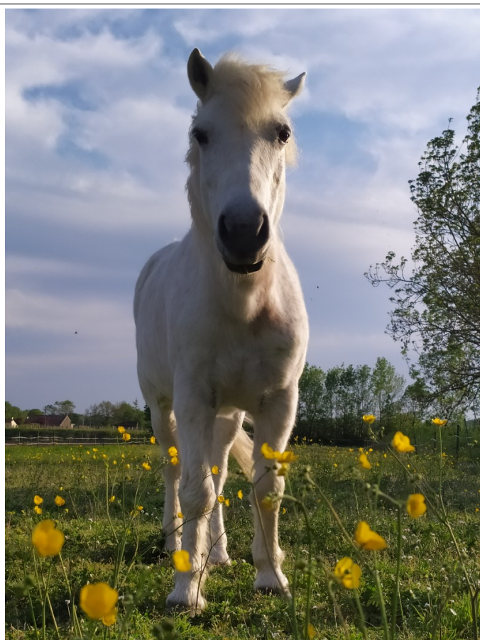
Elle a l'air maline à nous attendre !