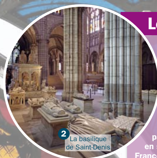
2 La basilique de Saint-Denis