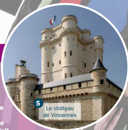
5 Le château de Vincennes

Louis IX a pour souci d'être juste envers son peuple et de faire régner le bien. Par exemple, la légende raconte qu'il invitait des pauvres à venir manger à sa table ou à venir lui parler au château de Vincennes, près de Paris, l'une de ses demeures. Le roi a aussi fait construire des hôpitaux. Et, pour se rendre compte des conditions de vie de ses sujets, il pouvait parcourir de nombreux kilomètres.