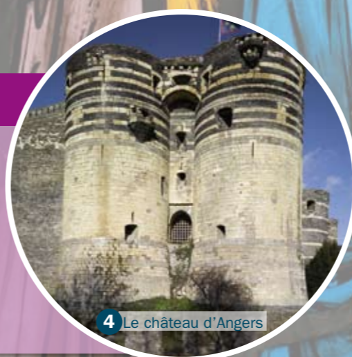
4 Le château d'Angers

À l'époque de Louis IX, la France n'a pas les mêmes frontières qu'aujourd'hui. Une partie du territoire est contrôlée par l'Angleterre, d'autres régions sont détachées du royaume de France. Louis IX affirme son autorité en agrandissant le royaume : il soumet des zones indépendantes, comme l'Anjou. Une fois le territoire gagné, il y fait construire une forteresse pour défendre la région (comme à Angers) ou des remparts autour des villes pour protéger les nouvelles frontières du royaume (Aigues-Mortes, Carcassonne).