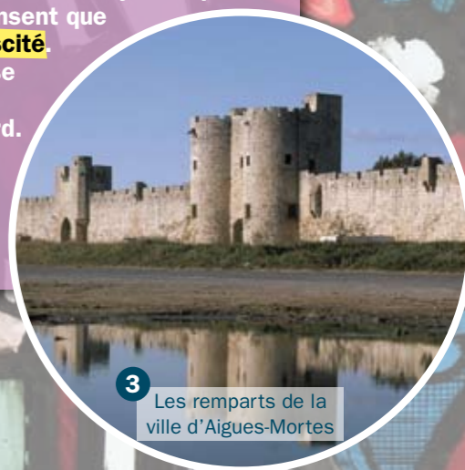
3 Les remparts de la ville d'Aigues-Mortes

Pour honorer sa foi, Louis IX mène deux croisades . Pour cela, il fait construire un port à Aigues-Mortes : la ville offre un accès direct à la mer Méditerranée. En 1248, il part en Égypte obliger le sultan à lui donner Jérusalem, en Palestine (aujourd'hui Israël). Cette ville est symbolique pour les chrétiens : ils pensent que Jésus y est mort et ressuscité . En 1270, Louis IX organise une seconde croisade à Tunis, en Afrique du Nord. Il espère y convertir le sultan à la religion chrétienne. Il meurt là-bas de maladie à l'âge de 56 ans.