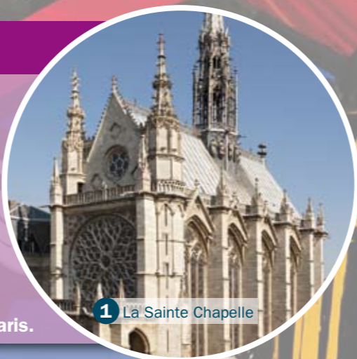
1 La Sainte Chapelle

Louis IX a reçu une éducation religieuse stricte auprès de sa mère, Blanche de Castille, une femme très croyante. Une fois sur le trône, Louis IX conserve sa foi et l'honneur. Il participe à la construction de nombreux bâtiments religieux (abbayes, églises, couvents...). Il dépense aussi des sommes d'argent pour acheter des reliques du Christ (le fils de Dieu pour les chrétiens). Pour les conserver, Louis IX fait construire une somptueuse église : la Sainte Chapelle, à Paris.