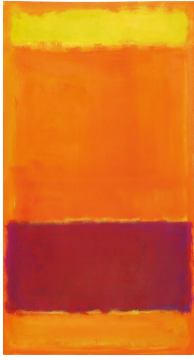
«Untitled » de Mark Rothko