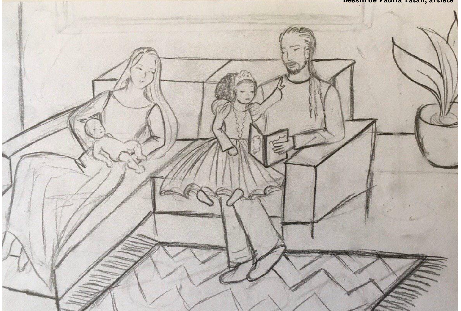
Dessin de Fadila Tatab, artiste