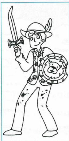
Le prince avant le combat

Entoure le mot en bleu qui convient pour compléter l'histoire. Aide-toi des deux dessins et de leur légende.