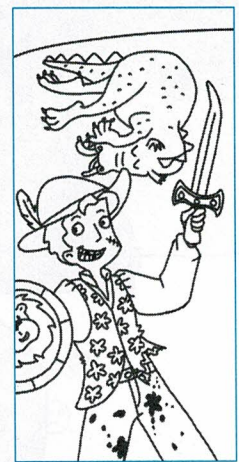
Le prince après le combat

Prince Étourneau est un drôle d'étourdi ! Il a perdu deux fleurs / plumes de son chapeau, mais il ne sait plus où. Son épée est tordue / cassée mais il ne sait plus pourquoi. Il a sali / déchiré son pantalon, mais il ne sait plus comment. Par contre, Prince Étourneau est courageux ! Il a combattu un dragon / lion et il a réussi à le tuer avec son épaule / épée tordue. Dans le combat, il a perdu deux dents, il s'est griffé la joue / main et il a déchiré le bas de son gilet / pantalon fleuri !