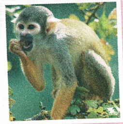
d. Le saïmiri