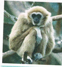
c. Le gibbon