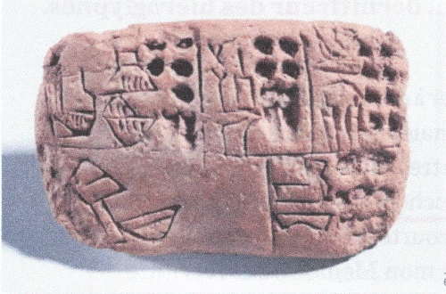
Tablette sumérienne : écriture cunéiforme.