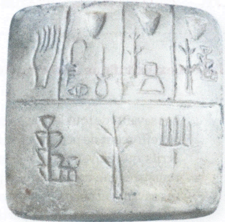
Pictogrammes (basse Mésopotamie, vers 3 300 avant J.-C.)