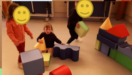
Jeux de construction