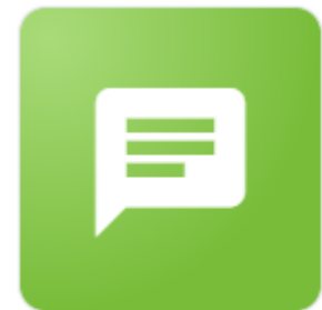
Carnet de liaison