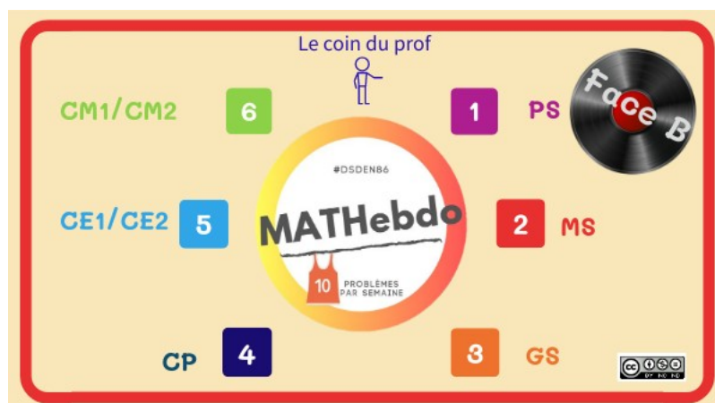
Plateforme MATHebdo Année B (Genially)

Les problèmes de la face B seront disponibles semaine après semaine.