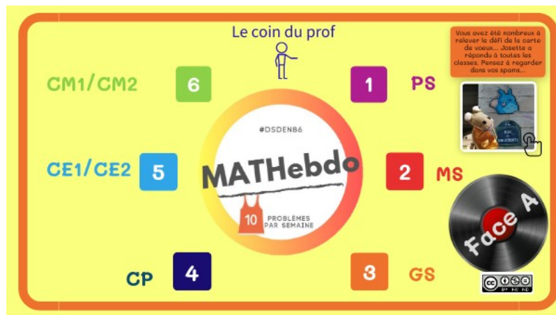
Plateforme MATHebdo Année A (Genially)

Cliquez sur l'une des deux roues ci-dessous puis sur votre/vos niveau(x) d'enseignement pour accéder aux problèmes.