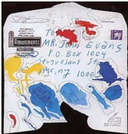
Œuvre de Ray Johnson