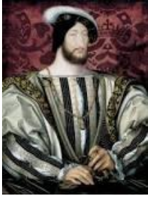
François 1 er