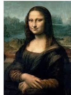
La Joconde de Vinci