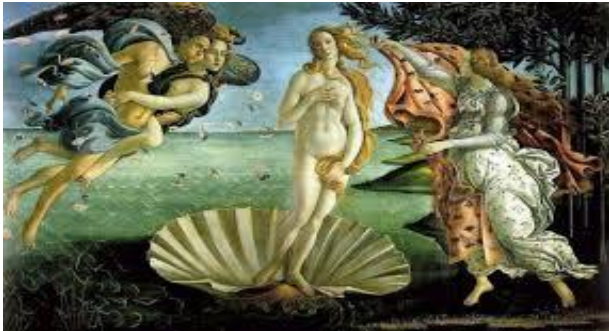
La naissance de Vénus de Botticelli