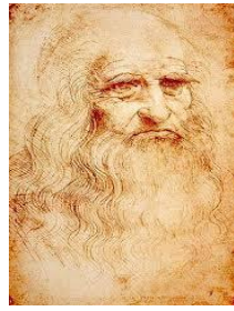
Léonard de Vinci