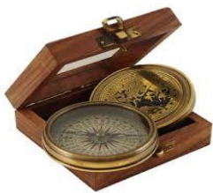
boussole pour se diriger

Du XVème jusqu'au milieu du XVIème siècle, de grandes inventions et des découvertes d'autres pays comme l'Amérique par Christophe Colomb en 1492 vont bouleverser la vie des hommes et entraîner la fin du Moyen-âge pour arriver à la Renaissance.