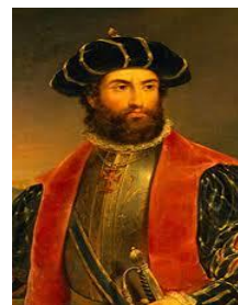
Vasco de Gama