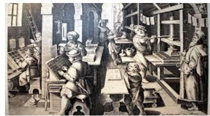
l'imprimerie de Gutenberg