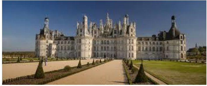
château de Chambord