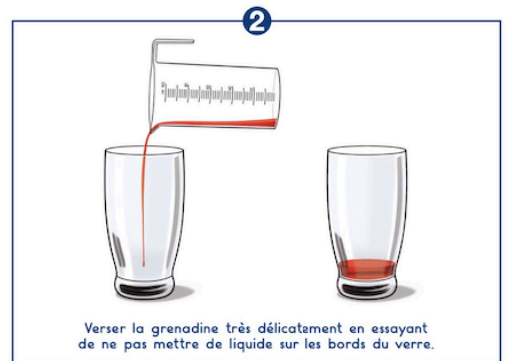
2 Verser la grenadine très délicatement en essayant de ne pas mettre de liquide sur les bords du verre.