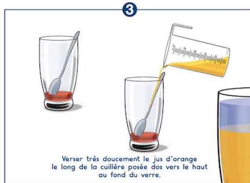
3 Verser très doucement le jus d'orange le long de la cuillère posée dos vers le haut au fond du verre.