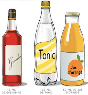
10 ML DE GRENADINE 30 ML DE TONIC 60 ML DE JUS D'ORANGE