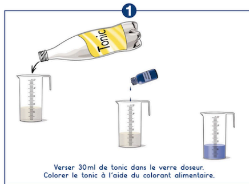
1 Verser 30ml de tonic dans le verre doseur. Colorer le tonic à l'aide du colorant alimentaire.