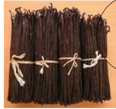
Les bottes de vanille prêtes à être vendues.