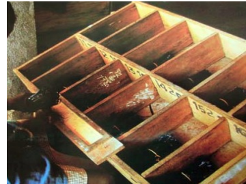
Le tri des gousses.