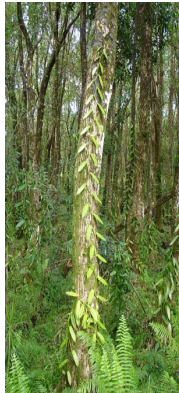
La liane pousse.