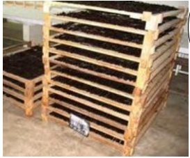
Le séchage à l'ombre.

A vous de mettre les images dans l'ordre !