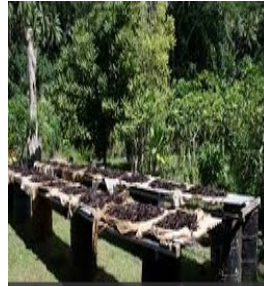
Le séchage au soleil.