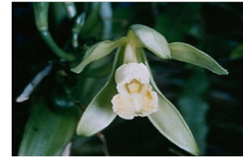
La fleur de vanille.