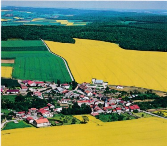
Un paysage à champs ouverts ( Moselle)