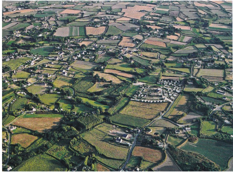
Un paysage de bocage (Côtes-d'Armor)