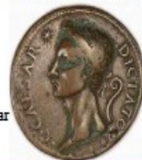
Monnaie de Jules César