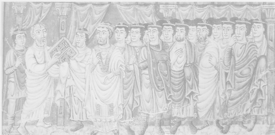
Doc. 2 Charlemagne entouré de ses vassaux, comtes et missi dominici (Bible, 845).

Le pape sacre Charlemagne en tant qu'empereur. Charlemagne prie, il est entouré du pape, de nombreux évêques (chapeaux blancs), présence de croix.