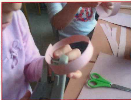
2 - Agrafe une bande pour former un anneau.