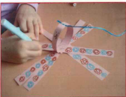
5 - Décore ton araignée.