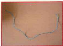
un bout de ficelle