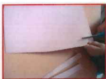
une feuille de papier