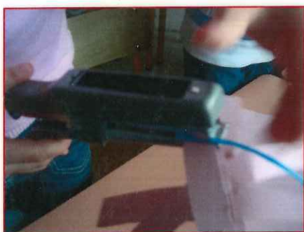
4 - Agrafe la ficelle sur le haut de l'anneau.