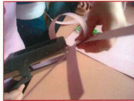
3 - Agrafe les autres bandes de papier dans l'anneau en les croisant.