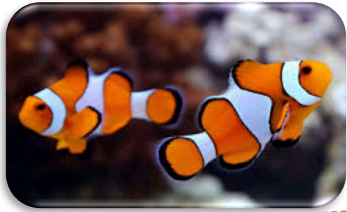
Un poisson clown

Les poissons ont des écailles. Elles protègent le corps du poisson.