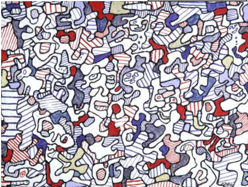
Allées et venues-1965