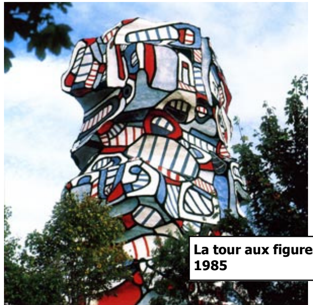
La tour aux figures 1985