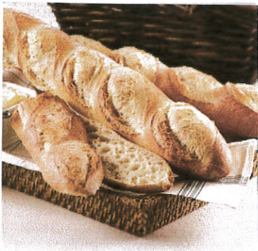
La baguette parisienne

En Île-de-France, il n'y a pas vraiment une spécialité culinaire précise. La baguette parisienne est très connue pour sa croustillance. Mais aussi le champignon de Paris, que l'on peut déguster froid ou chaud.