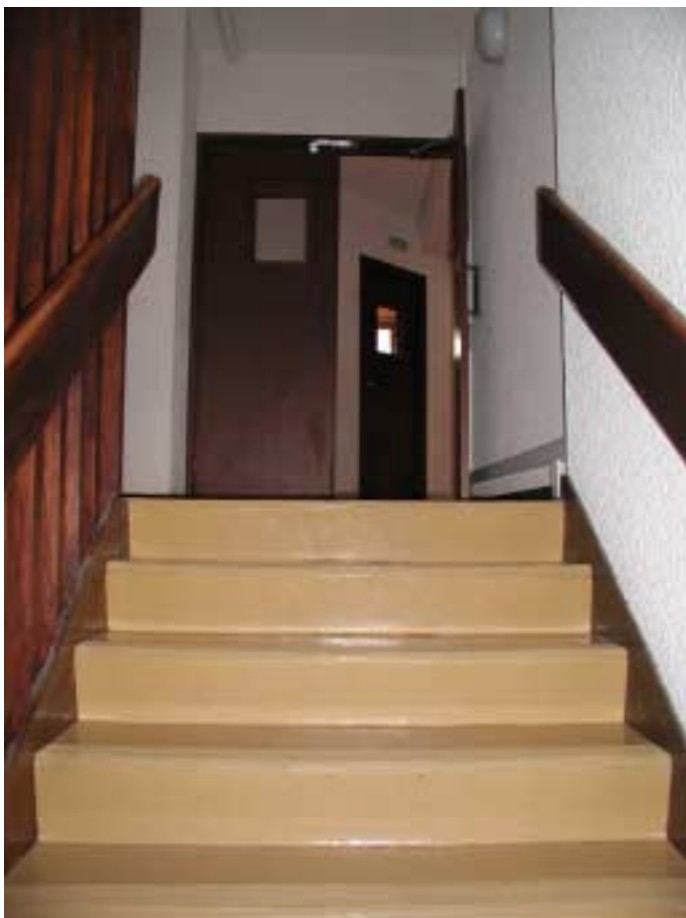
Accès au 1er étage