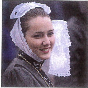
La coiffe de Mûr-de-Bretagne