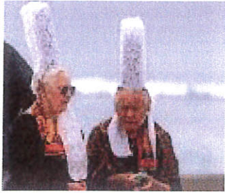
Les coiffes bigoudènes