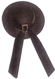
Le chapeau breton