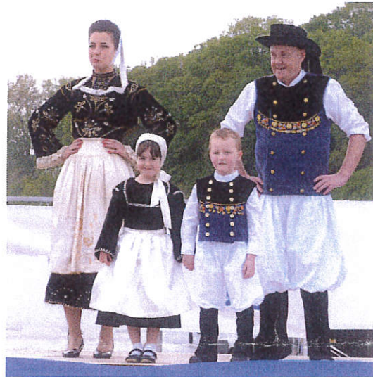
Un exemple de costume breton

Chaque région de Bretagne a son costume traditionnel.