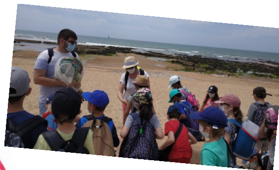
Les CP aux Sables d'Olonne