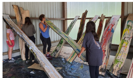
Les CM2 en création artistique avec la compagnie