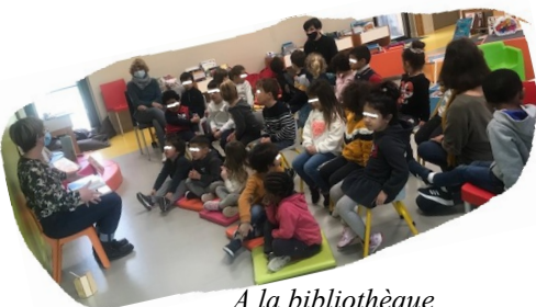
A la bibliothèque