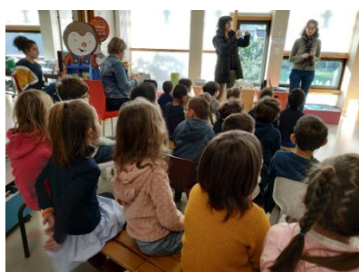
Les GS / CP à la bibliothèque