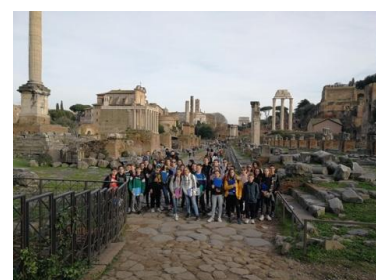
Les latinistes à Rome